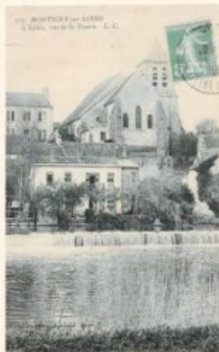
La maison de Maupassant rue de l'astre rive du Loing

En 1889, Guy de MAUPASSANT écrivain déjà célèbre, mais malade, vient chercher le repos dans cette maison en contrebas de l'église et au calme de la petite impasse de la Talbarderie.