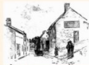
Illustration de Notre Cœur , Montigny sur la rue de l'Église