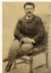
Guy de Maupassant en 1890, photographie