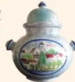
Baude, pot à couvercle avec vue de Montigny (DR)