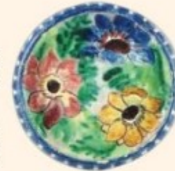
Baude, vase-pauche

Cette date marque l'arrêt de 86 années de production de céramiques d'art à Montigny-sur-Loing.