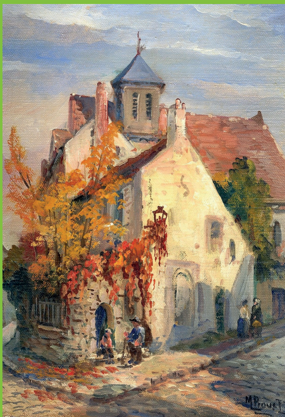
Couverture de l'ouvrage. Alexandre Delvaux, L'église vue de la butte . M. Proust, l'atelier Delvaux (collections privées, droits réservés)

L'auditorium est accessible aux personnes en situation de handicap moteur et aux personnes mal ou non-entendantes.