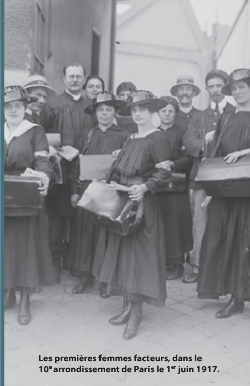
Les premières femmes facteurs, dans le 10 e arrondissement de Paris le 1 er juin 1917.